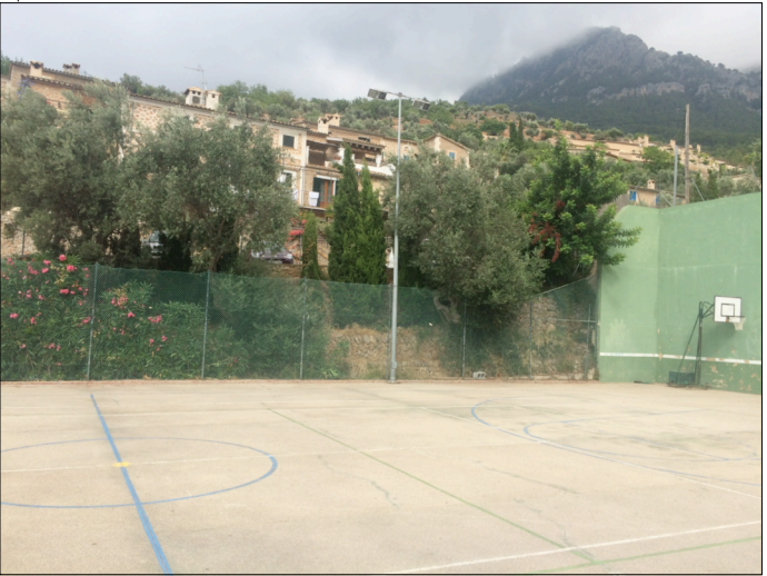
FOTOGRAFIA ACTUAL PISTA