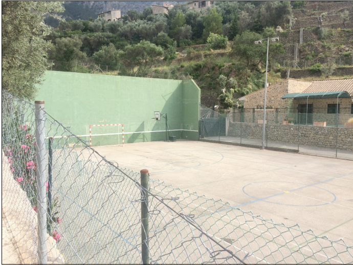
FOTOGRAFIA ACTUAL PISTA