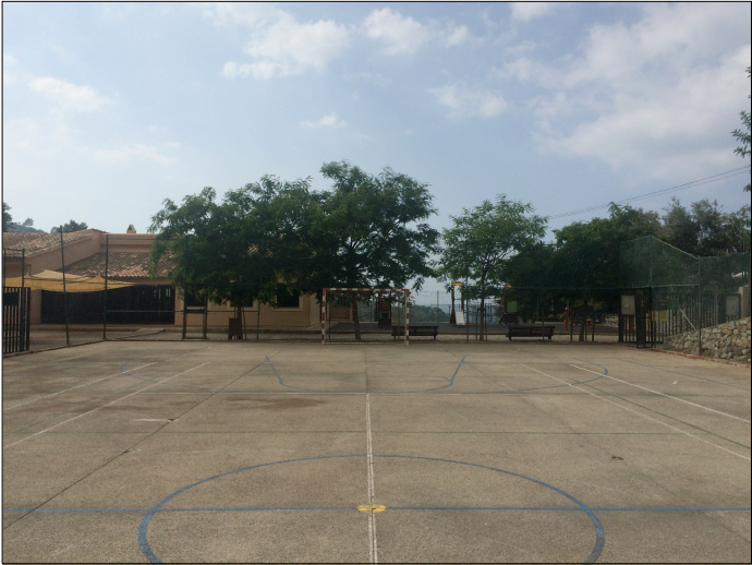
FOTOGRAFIA ACTUAL PISTA