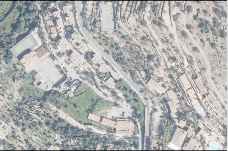
FOTOGRAFIA AEREA // Escala 1:5000